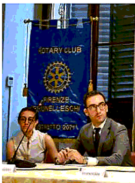
Un momento della serata organizzata anche dal Rotary