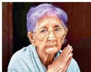
I RITRATTI Ecco alcune foto di Steve McCurry: dall'alto in senso orario, Afghanistan 2006, India 1993, Cuba 2010 e Pakistan 2002