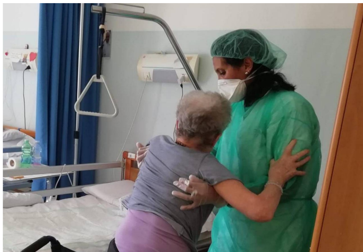
L'assistenza in una casa di riposo (foto di repertorio)

Mamme e papà, ragazzi e ragazze, ascoltateci, fateci questo immenso regalo. Dopo l'accurato appello del nostro Presidente della Repubblica, che abbiamo seguito con attenzione ma anche apprensione, anche noi