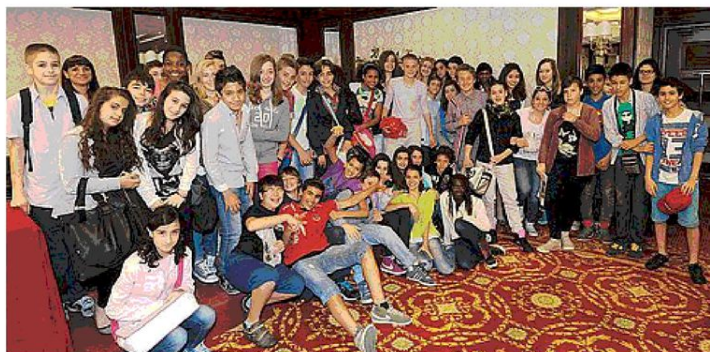
Il gruppo numeroso ed esuberante delle medie Guercino