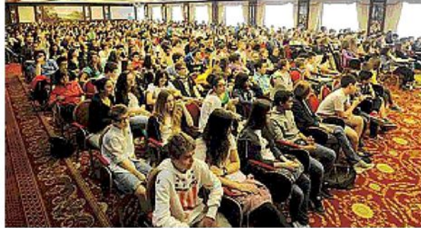
FOLLA La sala del Carlton gremita di ragazzi e insegnanti; sotto, i volti soddisfatti di alcuni piccoli cronisti